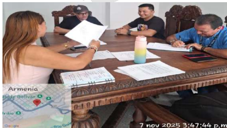
Aplicación baterías de riesgo psico laboral.

Otras inversiones como: exámenes laborales ingreso, periódicos, aplicación de baterías de riesgo psico laboral, entre otros.